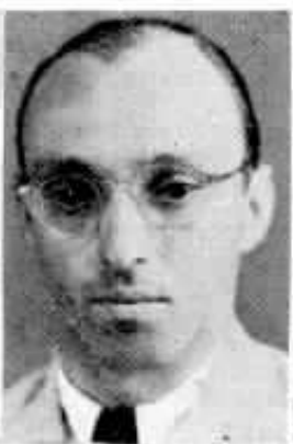
10 anos Otto Tross Conservação D. Federal