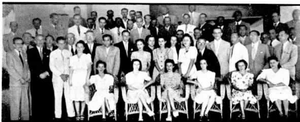
Grupo de funcionários do Distrito Este de Minas, concentrados em Cataguazes e que assistiram à entrega dos emblemas aos chefes e colegas que se tornaram veteranos