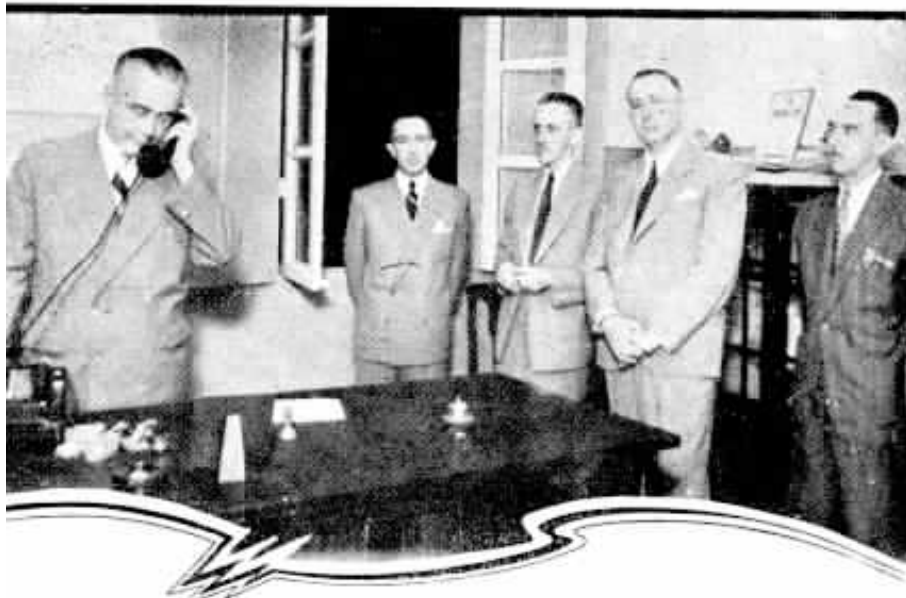
O Dr. Raul Travassos da Rosa, Prefeito de Itaperuna, quando inaugurava o serviço telefônico local