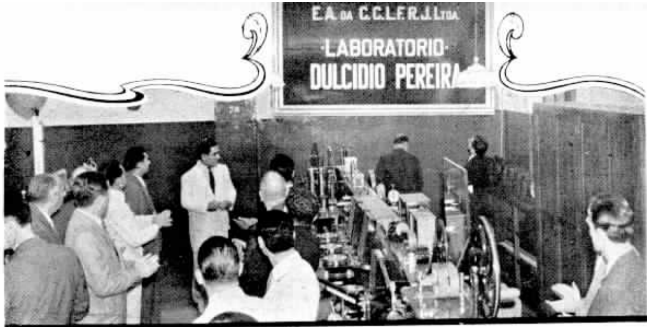
Aspecto da inauguração da placa com a inserção do "Laboratório Dulcício Pereira"

tico o ensino da eletricidade, com a imediata verificação experimental de suas leis principais. Isso constituía mesmo uma aspiração de alunos e professores manifestada constantemente.