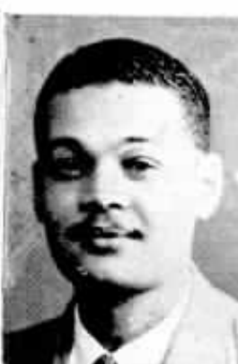
10 anos Nito F. Lage Estudos da Planta — D. Federal