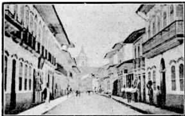
A Rua Direita em 1880. Assinalado com uma cruz vê-se o prédio do Clube Paulistano, no lugar chamado "4 cantos", onde mais tarde funcionaram os escritórios da Cia. Telegraphos Urbanos. Ao fundo a torre da igreja da Sé.

Hoje, que São Paulo é uma vasta metrópole, dotada de uma extensa e complexa rede telefônica servindo a dezenas de milhares de aparelhos dos mais modernos que a técnica telefônica tem produzido, interessante seria voivermos a uma época não muito remota, 60 anos apenas, e conhecer