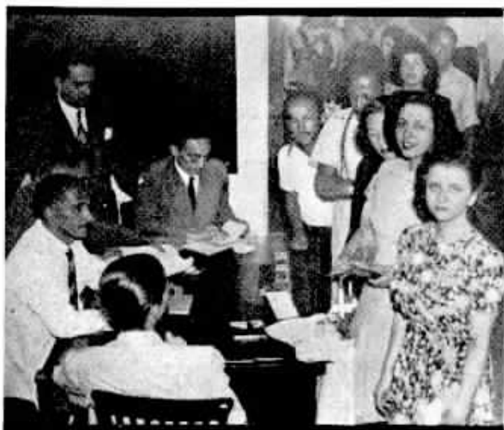
Outro aspecto da mesa n.º 35, quando era visitada por um Chefe de Divisão do Ministério do Trabalho, fiscalizando os trabalhos.

crático foi o que de início assinalamos: — em sua quase unanimidade, os votantes aceitaram o acôrdo negociado entre o Ministério do Trabalho, a Comissão Legislativa e as empresas.