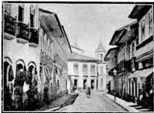
Casas comerciais da Rua Direita, em S. Paulo, onde em janeiro de 1884 foram instalados os primeiros aparelhos telefônicos. Ao fundo divisa-se parte da igreja de S. Pedro, no largo da Sé.

"Sabemos que a Cia. Telegraphos Urbanos pretende estabelecer uma rede de fios telegraphicos e telephonicos. Informamos que a Cia. tem tôdas as patentes dos inventores europeus e americanos e conta com plena autorização do Governo Geral.