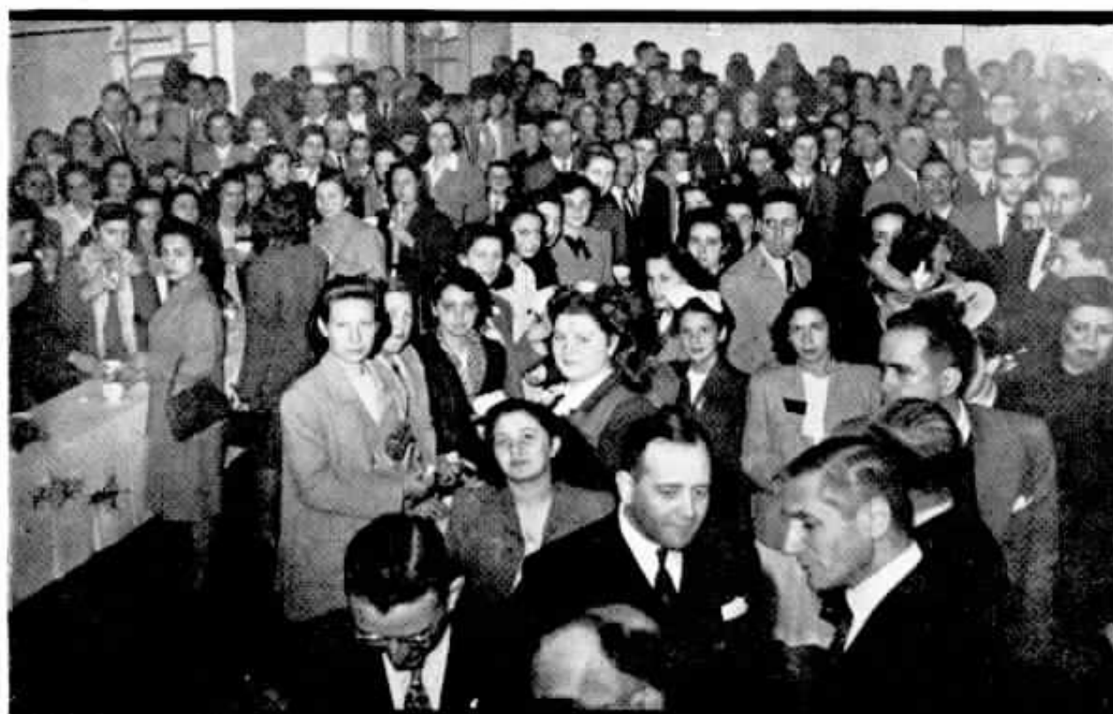
Aspecto parcial apanhado no refeitório do Externato da Ordem Terceira de S. Francisco.

Sofremos, porque vemos a velhice trôpega e maltrapilha sem ter uma alma jovem que a ajude a suportar a sua "via crucis".