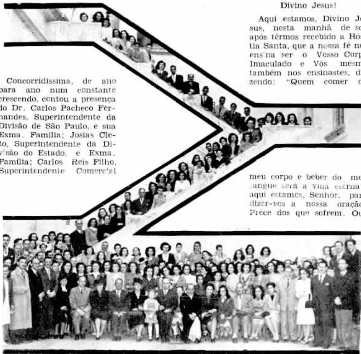
Grupo formado no pátio do Esternato da Ordem Terceira de S. Francisco, após o café servido no refeitório desse estabelecimento.

meu corpo e beber do meu sangue terá a vida eterna; aqui estamos, Senhor, para dizer-vos a nossa oração: Prece dos que sofrem. Ou-