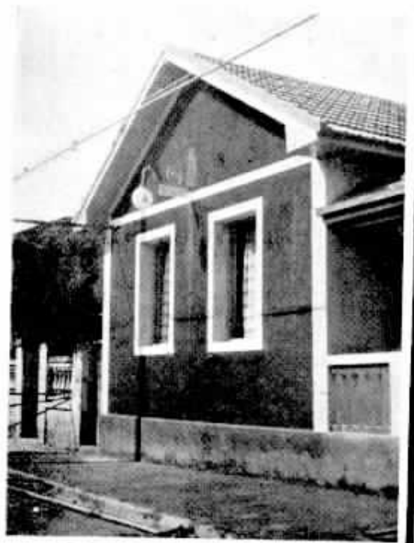
Sede do novo Centro Telefônico.