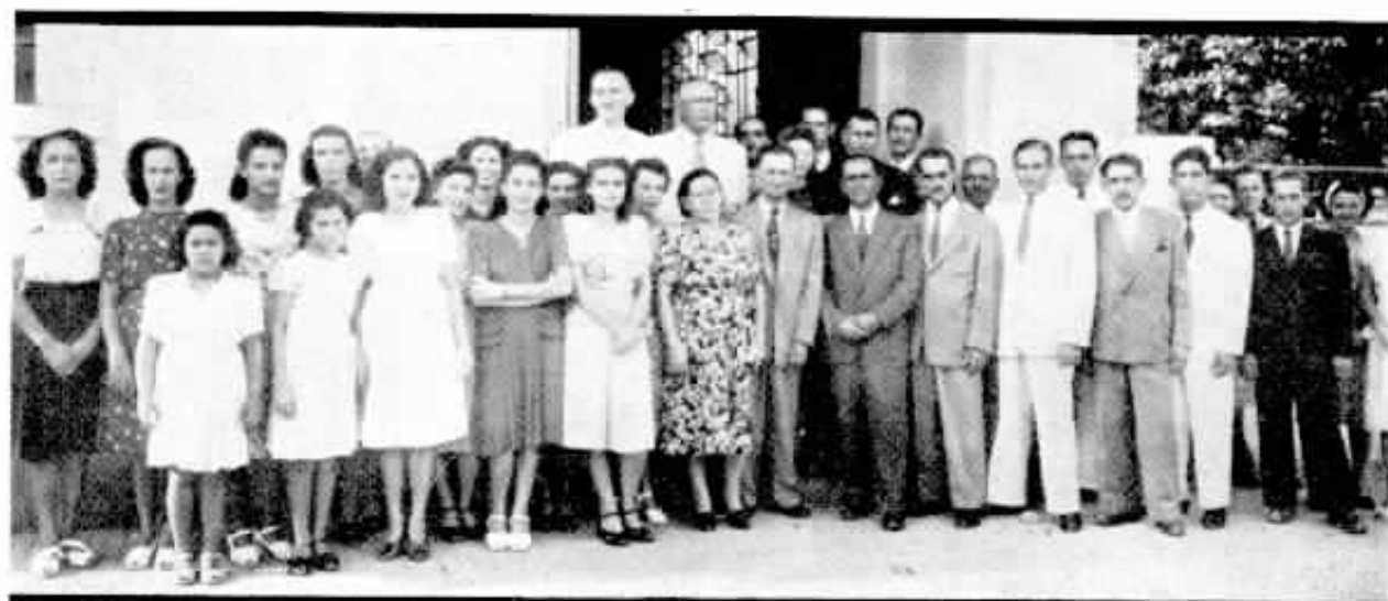
Grupo feito em frente à estação telefônica de Barra Mansa.