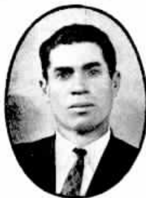
20 anos Paschoal Cordoni Conservação S. Paulo