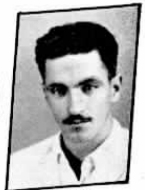
10 anos Anthero D. Arouca - Conservação - D. Federal