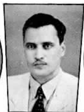
10 anos Gelobes Pco. Rangel - Conser- vação-D. Federal